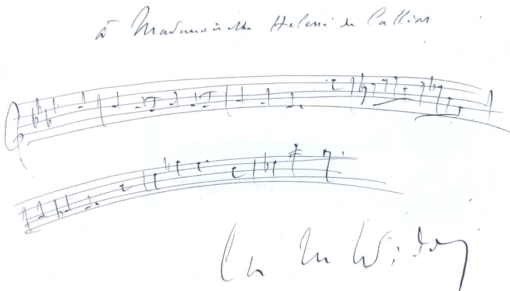
Notiz Widors auf einer handschriftlichen Grußkarte mit dem Thema der „Romance“ (Original im Besitz des Herausgebers)